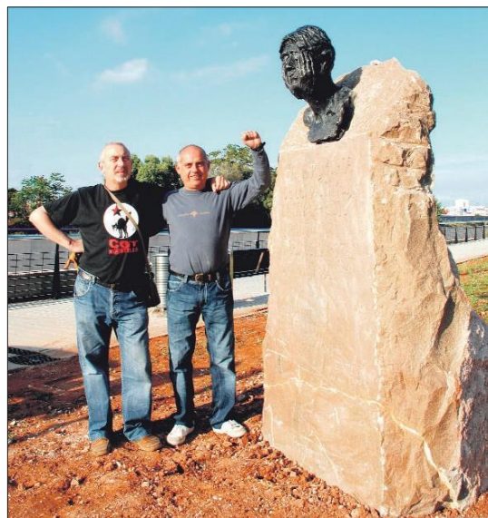
¶ Monolito a las Víctimas en el Riu Sec, lugar de las ejecuciones.

Finalmente, en acta del 22 de octubre de 1937, acordada entre CNT y las colectivistas y el Consejo Municipal, Unión Republicana, Izquierda Republicana, una UGT recién creada en el pueblo por imposición gubernativa, para representar a los individualistas, con párrafos textuales como "4º.- La Colectividad está dispuesta, con el fin de que reine la armonía y dando una prueba más de altruismo, a que se revisen las incautaciones todas que de hecho por sin-