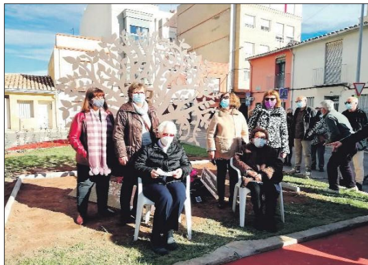
¶ Familias de Almassora durante la colocación del Memorial democrático a las víctimas.

Contó la Colectividad con más de mil quinientas asociadas, aplicando métodos de trabajo rotativos, asamblearios y participativos.