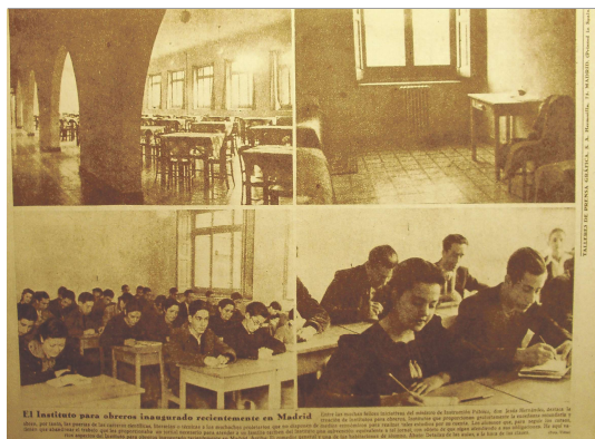
▲ Crónica, Madrid, 3 de abril de 1938. ACIO

Al Durruti accedieron desde mediados del año 1937 y diciembre de