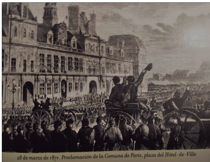
28 de marzo de 1871. Proclamación de la Comuna de París, plaza del Hôtel-de-Ville

Este Congreso acordó la no participación de la FRE en política, uno de sus acuerdos fue el siguiente: "el Congreso recomienda a todas las secciones de la Asociación Interna-