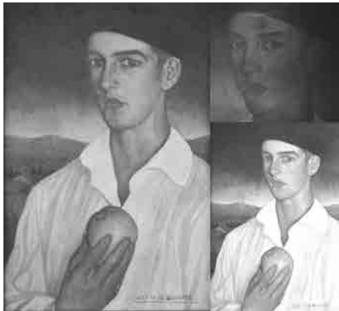
12 de septiembre de 2017 - Retrato de joven vasco de Valentín de Zubiaurre.

Ejemplo de chicarrón del norte, de esos que inspiran coplas y te dejan el corazón partío. Este llegó con algo de humedad en los huesos, algunas arrugas y demasiado relajado. Su ropa sucia y la fruta deslucida me hablaban del largo camino hasta mi casa, pero una chispa de nobleza brillaba en el fondo de sus ojos, bajo el polvo. Ahora se va. A pesar de todo el mimo que le he dado. Ahora, que ha descansado y recuperado su vigor, le dejo ir con su dueña, con su camisa limpia, sus mejillas sonrosadas y su manzana nuevamente fresca. Lo dicho... partío.