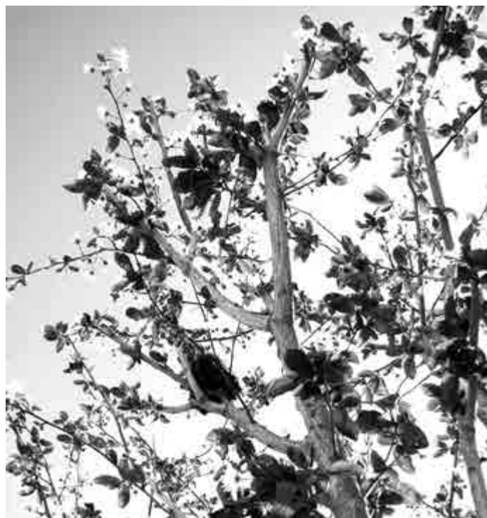
Árboles de Redondela 21 de marzo de 2018

la cantante llevaba un sombrero igualito al que tuvo ella el año pasado. Lo perdió. Me acuerdo de él porque tenía como un pájaro con plumas azules y blancas y a mi los pájaros me encantan.