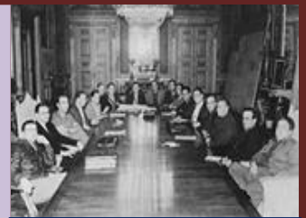
Comité de Milicias Antifascistas, órgano revolucionario y verdadero gobierno en Cataluña hasta Octubre del 36

Este fue el argumento con el que el secretario del PSUC (también afiliado a UGT), J. Comorera, convenció al resto de fuerzas políticas para ocupar el edificio. Sí que era evidente que cualquier conversación, incluidas las mantenidas por los altos dirigentes de la Generalitat y del propio Azaña, que residía en Barcelona, eran controladas por la CNT., que por otra parte este sindicato también formaba parte del gobierno catalán con varios consellers. Surge la polémica en que si por ley no se otorgaba específicamente el control de las comunicaciones, entrando en contradicción con lo que a juicio de la CNT constituía un derecho conquistado por la revolución, conseguida en esos primeros momentos por la entrega y el esfuerzo mayoritariamente de los militantes de la Confederación. El control suponía un poder real que ni PSUC (partido que controlaba la UGT catalana), ni la Esquerra podían tolerar si querían aspirar al dominio del territorio como era su intención.