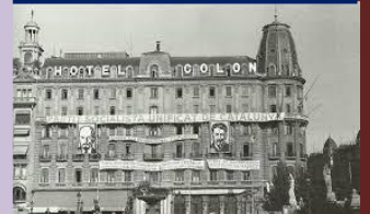
Hotel Colón, situado frente a la Telefónica en la plaza de Cataluña, sede del Partido Socialista Unificado de Cataluña, lugar desde se podía barrer toda la plaza con fuego de ametralladora. Fue fundado el 23 Julio del 36 tras la fusión de la Unió Socialista (PSOE), el Partido Comunista y el Partit Catalá Proletari