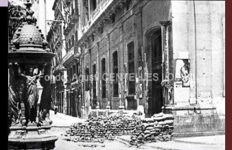
Barricada en la Ronda de Santa Mónica