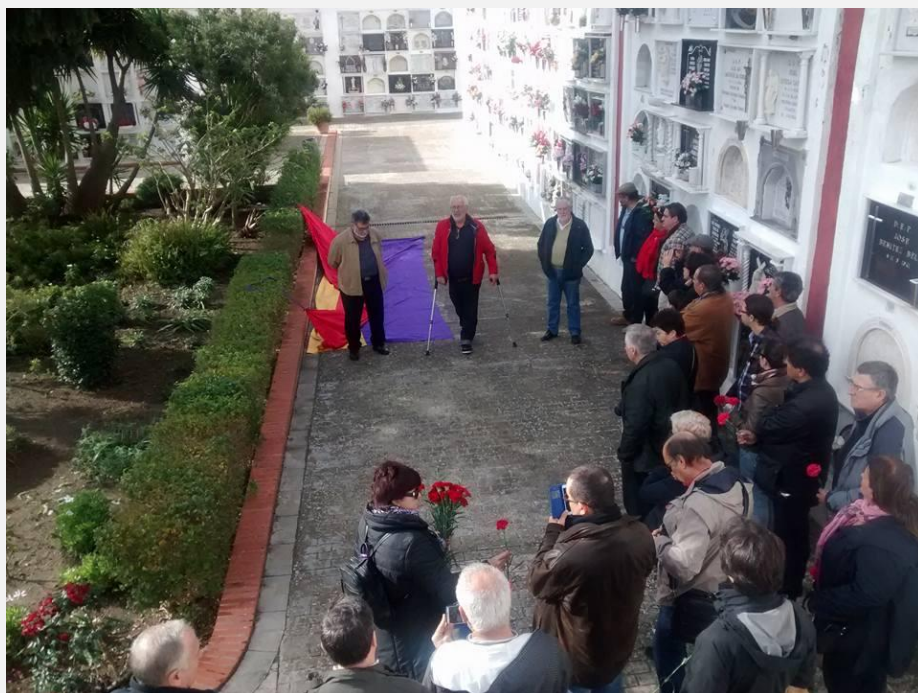
Homenaje en el cementerio de Medina Sidonia el 10 de enero de 2016