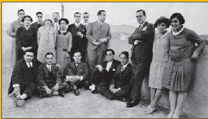
Artistas e intelectuales en el Ateneillo de L'Hospitalet

El actual separatismo catalán se está creando unas raíces creíbles y eficaces para su discurso. Para ello utiliza herramientas fáciles de emplear. En primer lugar, ubica sus orígenes en la Segunda República, es decir, hay que dotar al separatismo actual de una trayectoria histórica llena de reivindicaciones soberanistas. Para ello es necesario nacionalizar los movimientos sociales a lo largo de la historia, miminizando a la CNT, creando un movimiento sindical catalán, basado en organizaciones minoritarias y marginales (que durante la Guerra Civil fueron absorbidas por la UGT) a las que se le otorga una representatividad potente, pero inexistente en la documentación tanto histórica como real.