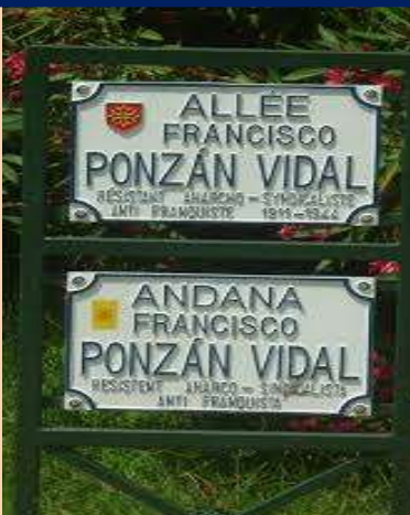
Calles dedicadas a Ponzán en Toulouse.