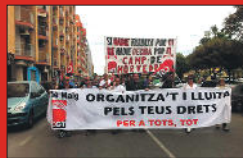
Port de Sagunt