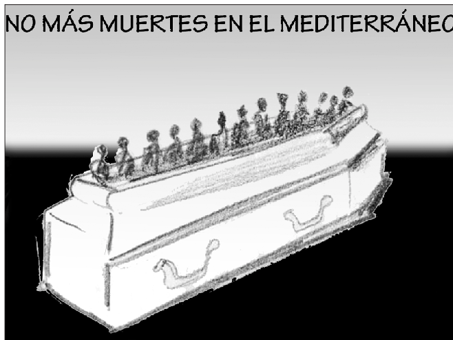
ILUSTRACIÓN: PAULA CABILDO

REDACCIÓN: Sagunto, 15, 1 o . 28010 Madrid TELÉFONO: 914 470 572