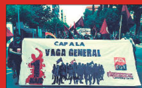
Vilanova i la Geltrú