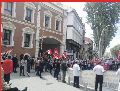
Alcázar de San Juan